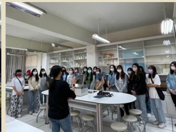
始業式兩個場地同時進行