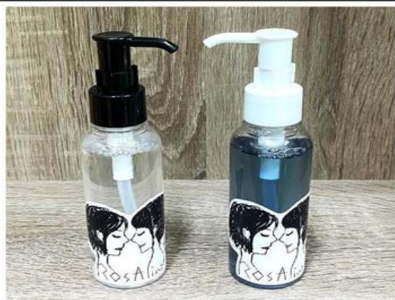
(左) 復顏青春玫瑰菁華 (右) 光華玫瑰馥香晶露