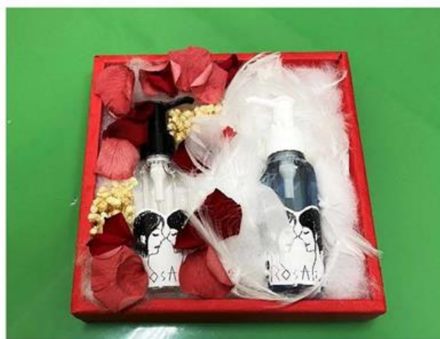
玫瑰菁華套組內裝