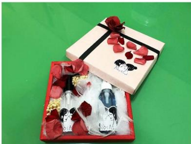
童話系列 玫瑰菁華套組小禮盒