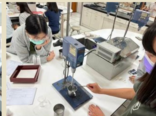
個別主題老師分開授課